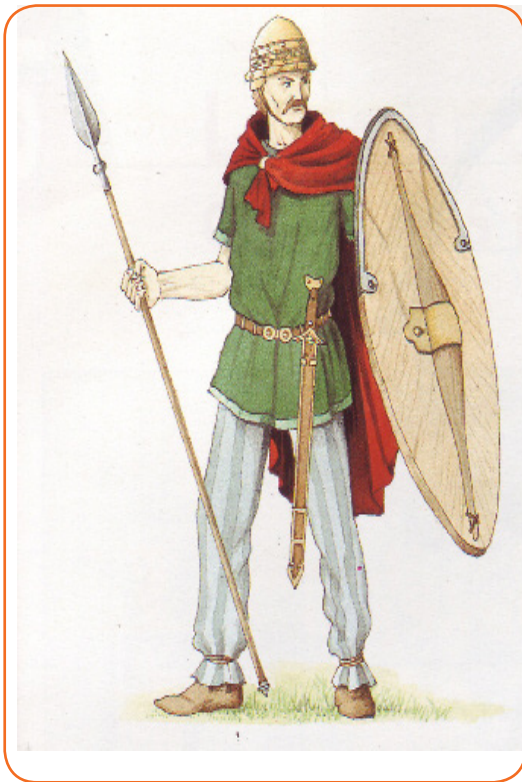
Reconstitution d'un guerrier gaulois