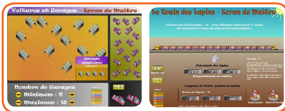
Illustrations 6 : Écrans du maître des logiciels « Voitures et garages » et « Train des lapins »

Lorsque l'on propose des ressources mathématiques pour l'école, il convient de se questionner sur ce qu'apportent ces ressources aux professeurs des écoles pour adapter leur enseignement à chacun des élèves de leur classe. Ce point est central lorsque ces ressources s'adressent à des élèves d'école maternelle car les différences entre enfants peuvent être importantes. Le nouveau programme de l'école maternelle (applicable à la rentrée 2015) souligne bien cet aspect. Pour les logiciels « Voitures et garages » et « Train des lapins », cette question de la différenciation a été prise en compte dès le processus de conception des logiciels. En effet, pour permettre aux professeurs de personnaliser le parcours des élèves sur le logiciel, des éléments du logiciel sont paramétrables par ces derniers sur l'écran du maître.